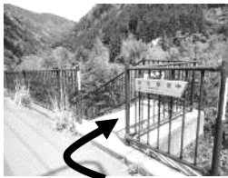
タバコ販売機の対面で右に曲り階段を降りる

④ 数馬の切通し 元禄16年(1703年)に氷川・朽久保両村民の資力、労力で完成。これにより小河内方面・多摩川南岸と五日市方面、日原・大丹波と秩父方面の交通が密接になった。昭和52年11月3日、奥多摩町指定史跡となった。